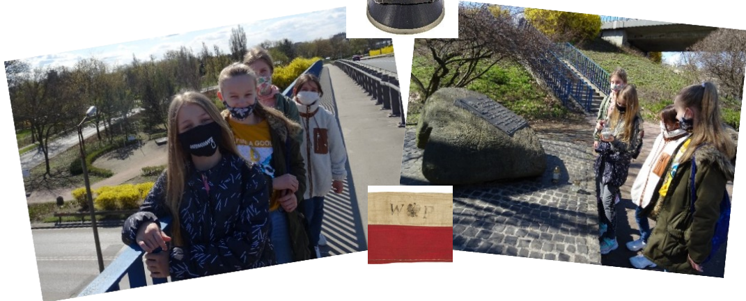
Pomnik ku czci gen. Leopolda Okulickiego – ostatniego komendanta Armii Krajowej

Patriota to osoba, która dba o dobre imię swojej ojczyzny.