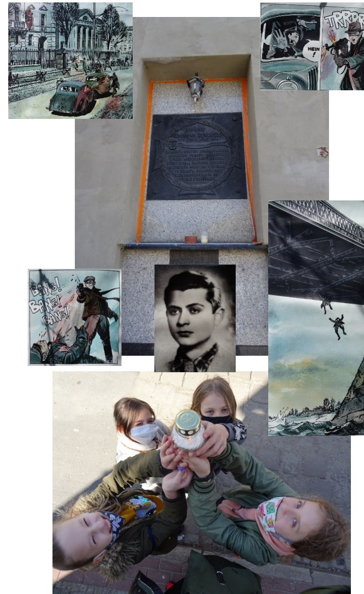
Tablica pamiątkowa poświęcona żołnierzowi AK Zbigniewowi Gęsiickiemu ps. Juno