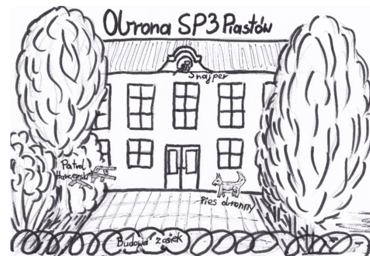
Plan obrony Szkoły Podstawowej nr 3