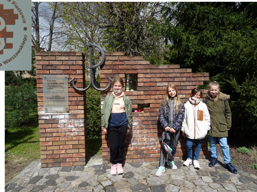
Pomnik poświęcony Bohaterom Powstania Warszawskiego