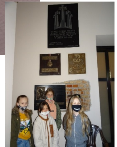
Tablica upamiętniająca Polaków zamordowanych podczas II Wojny Światowej w Ponarach k. Wilna