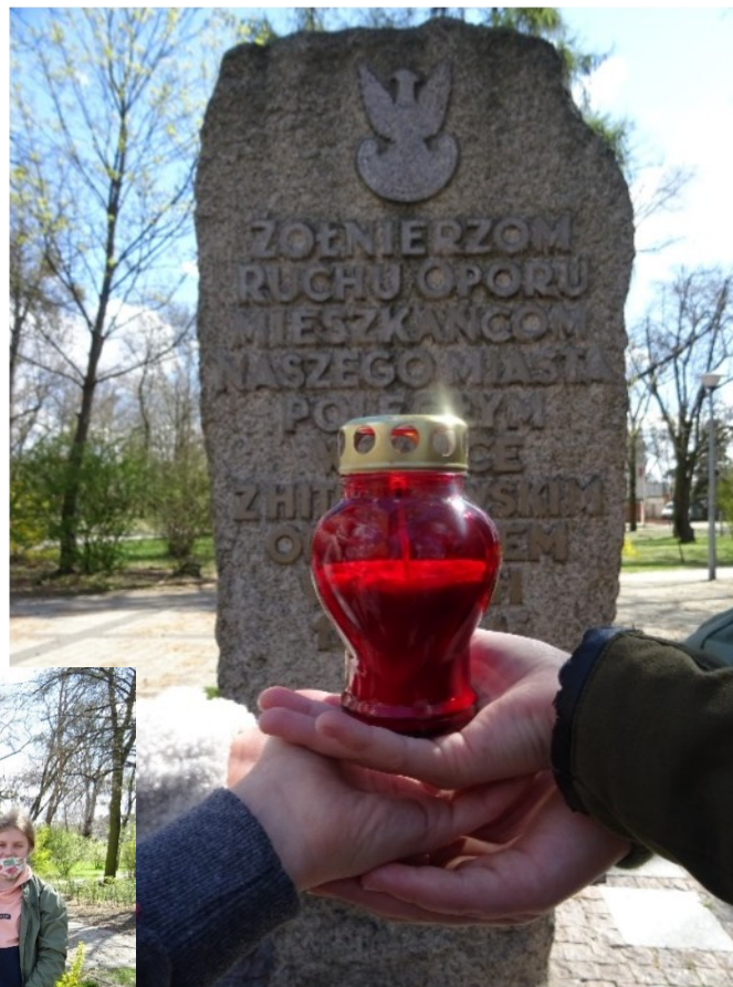
Pomnik ku czci poległych mieszkańców Piastowa w latach 1939 - 1945

Dziękujemy naszym dzielnym strażakom za tak sprawną akcję.