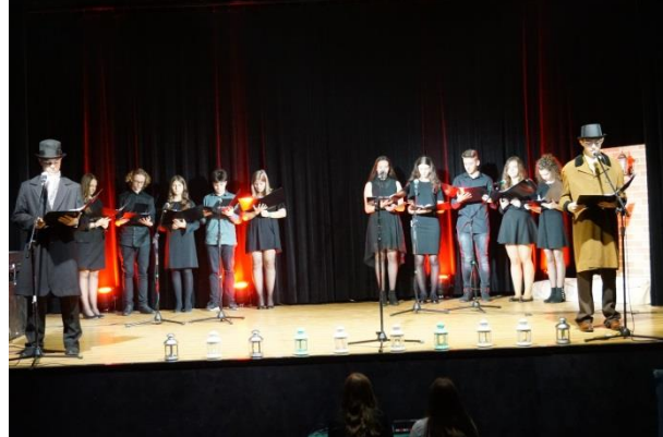
Fot. 2 scena 1 Postacie