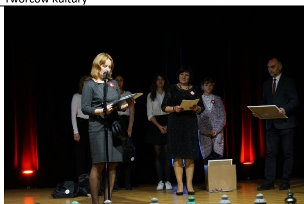
Fot. 15 uroczystość rozdania nagród w Projekcie „My Polacy – niepodlegli, przedsiębiorczy”