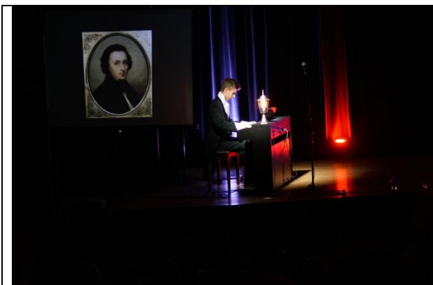
Fot. 8 scena 7 Fryderyk Chopin