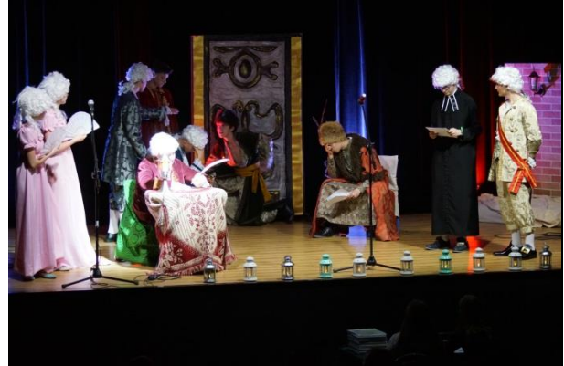
Fot. 3. scena 2 Rejtan