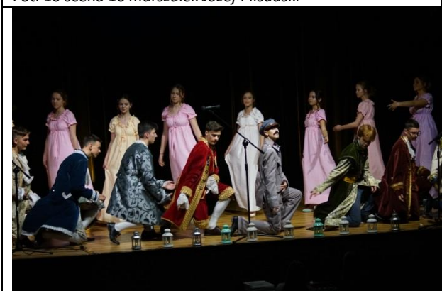
Fot. 12 scena 12 Polonez Wolności i Niepodległości