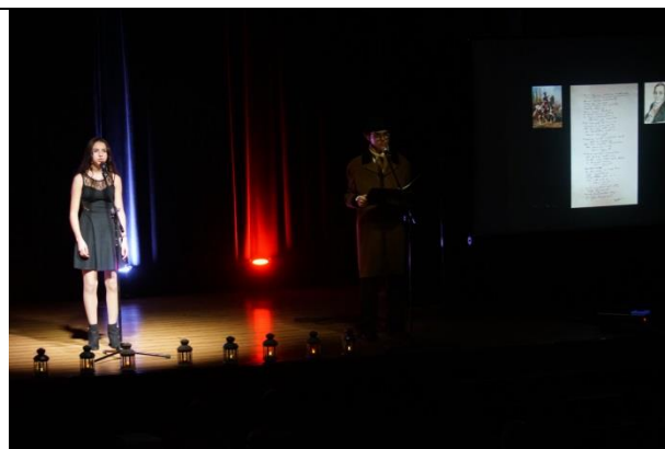
Fot. 9 scena 8 generał Jan Henryk Dąbrowski