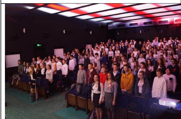
Fot. 14 wspólne odśpiewanie wszystkich 4 zwrotek Hymnu Państwowego przez Uczniów Szkoły