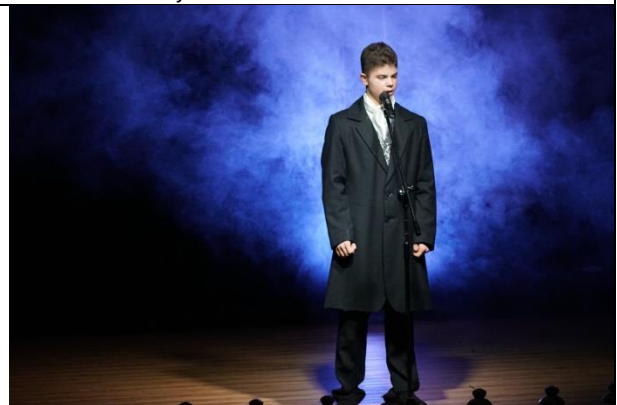
Fot. 5 scena 4 recytacja Reduta Ordona