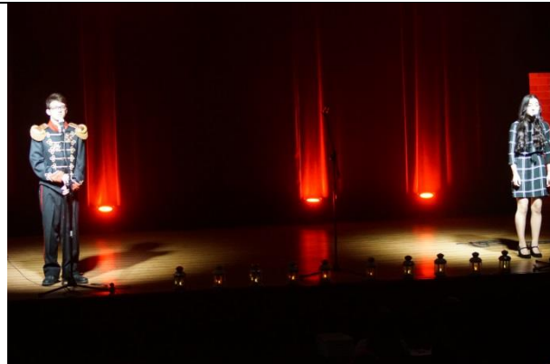
Fot. 6 scena 4 recytacja Sowiński w okopach Woli