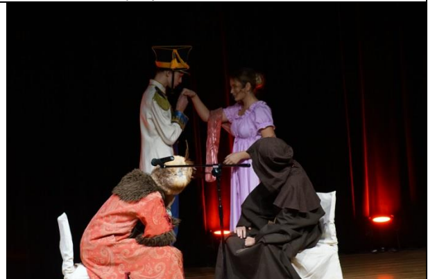
Fot. 7 scena 5 Pan Tadeusz