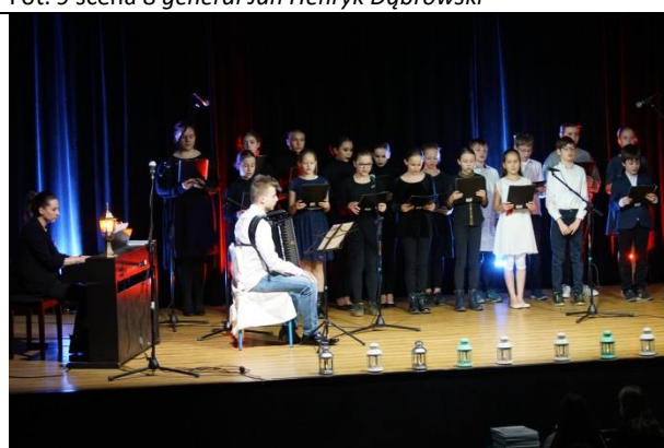
Fot. 11 scena 11 pierwszo-kadrowy koncert legionowy