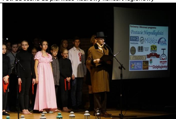
Fot. 13 uroczyste podziękowanie Mecenansom Młodych Twórców Kultury